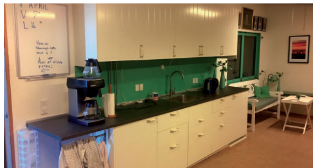
Det nye køkken

stranden til den inciterende klezmermusik, som er traditionel jødisk folkemusik – specielt danse musik.