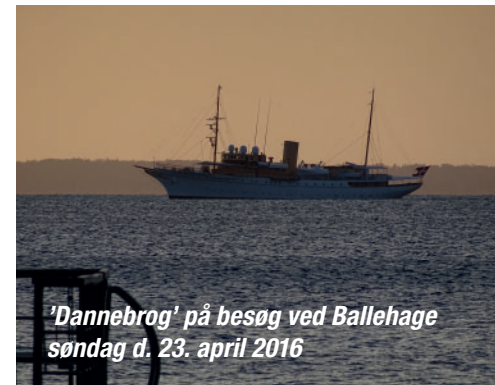
'Dannebrog' på besøg ved Ballehage søndag d. 23. april 2016

Nye medlemmer må også gerne melde sig som tillidsfolk, det er en god måde at lære klubben og dens medlemmer at kende.