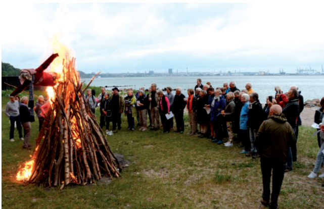
Skt. Hans – bålet og heksen brænder lystigt

Lad os i stedet fylde vore hjerter og vort samvær endnu mere med alt det, vi ønsker og gerne vil have mere af, alt det positive og det glædelige.