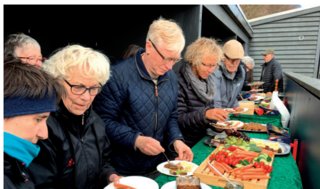
Rengøringsdag – den velfortjente frokost indtages

Frokosten var både god og velfortjent – der var ydet en flot indsats – selv skorummet lugtede nu af sæbe og de sædvanlige 'gasdunster' var for en tid forsvundet!