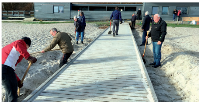
Rengøringsdag Graverholdet 'knokler'

Tilslutningen til årets store rengøringsdag var flot. Ca. 50 medlemmer havde meldt sig til: Rengøring af omklædningsrum, afvaskning af facade med algerens,