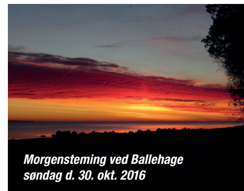
Morgenstemning ved Ballehage søndag d. 30. okt. 2016