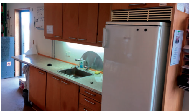
Det gamle køkken

Efter den korte tale bød Klezmerduo – med harmonika og sopransaxofon – op til dans – kædedans – og der blev danset ud ad broen og tilbage igen og rundt på