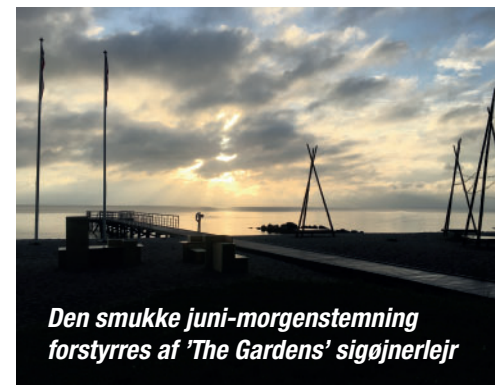
Den smukke juni-morgenstemning forstyrres af 'The Gardens' sigøjnerlejr