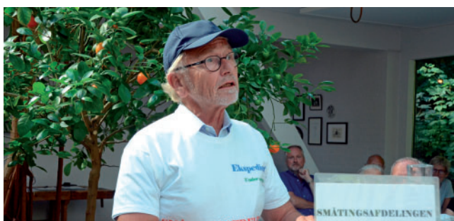
Formanden 'ekspederer' i småtingsafdelingen! på GF 2016

Udover at køkken- og saunaprojekterne har fyldt meget på bestyrelsesmødernes dagsorden, så har vi drøftet en revision af foreningens love. Et par revisioner vil blive forelagt generalforsamlingen.